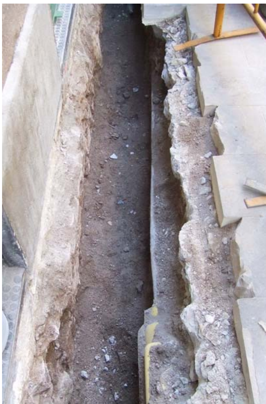
Fotografia núm. 3: vista de la rasa 200