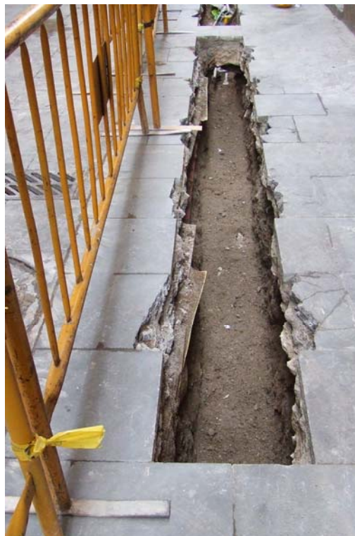
Fotografia núm. 2: vista de la rasa 100