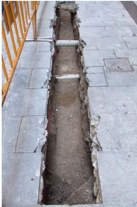
Fotografia núm. 1: vista de la rasa 100